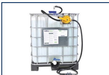
EFFINOX IBC 1000L