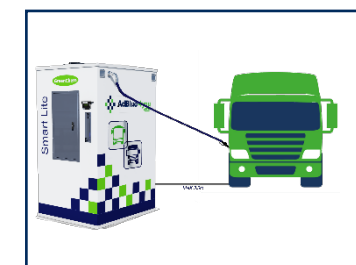
Solutions de distribution SMART