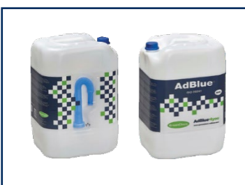
Bidon de 5/10/20L AdBlue®