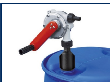
Pompes rotatives pour fûts