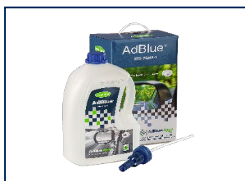
Kit de démarrage d'AdBlue