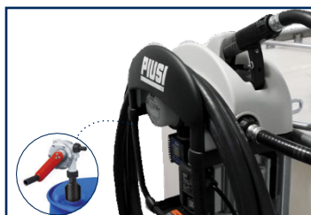
POMPE pour votre IBC