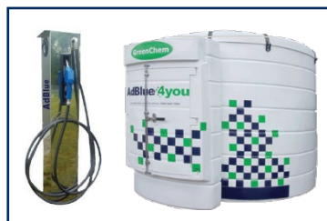
Réservoirs et poste de distribution